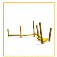
7. Balancerestoel sthoek incl. schaduwdoek PST,105,039