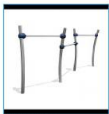
2. Duikstijl Trio Pioneer SOL,030,221