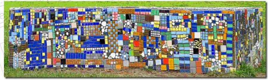
8. Bank, mozaïek wordt gemaakt door de kinderen