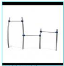
4. Duikstijl Trio Pioneer SOL,030,226