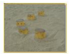
6. Slanlam PST,000,511