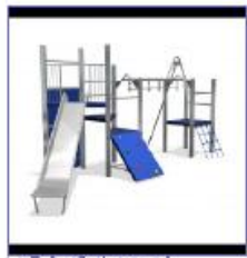
1. Vrijbeker 360 multiactiviteit VRB,090,107